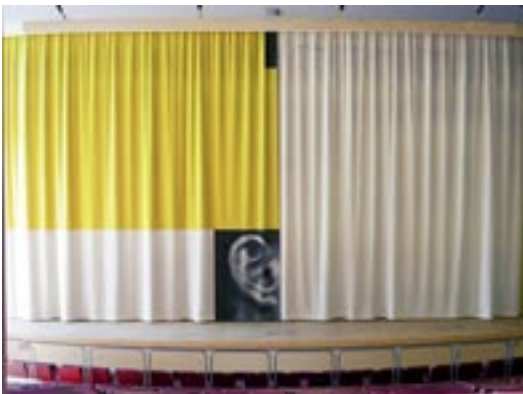
"I still hear your name, the cave", av Anders Widoff för Vara konserthus 2003, 9,6 x 16,5 m. Handvävt bottentyg, infälld bildväv och handbroderad text.