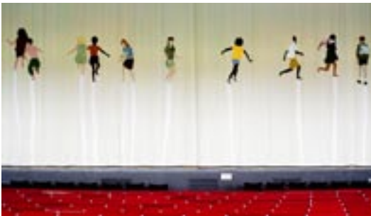
"Kompisar från förr" av Karin Mamma Andersson för Hermelinskolan i Luleå 2005. 7,32 x 13,20 m.