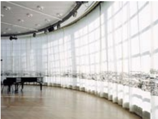
"Horisont" av Ulrika Mårtensson för Kungliga Operan/Rotundan 2003. Fondridå, sex delar, 43 m 2 ; sidoridå, 24 delar, 145 m 2 ; gardiner, åtta delar, 15 m 2 . Tryck och handbroderi på ullfilt och transparent polyester.