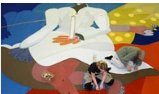
Ridå av Björn Carlsen för Askers kulturhus, Asker utanför Oslo 2006. Skadat bottentyg utbytt mot nytt, hälften av applikationerna utbytta mot nyinfärgade. Totalt 260 m 2 .