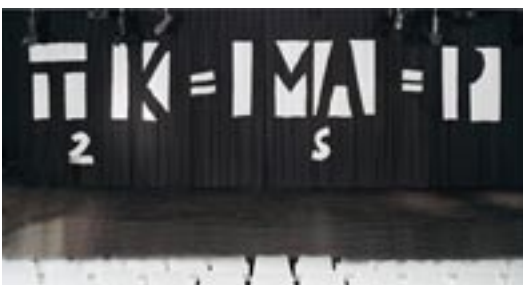
"Clinamen" och "TK/2=MA/s=P" av Elis Eriksson för Konstfackskolan, 2004. Två svart/vita ridåer med applicerade mönster, 4,10 x 15,40 m vardera.