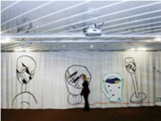
"Slipat glas och kaffesjö" av Jarl Ingvarsson för Operakällaren, Stockholm 2005, 2,9 x 10,15 m. Applikationer på ullfilt.