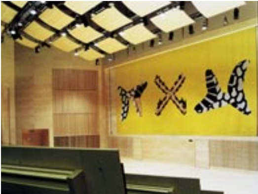
"Tre figurer", av Petter Zennström för Högskolan i Karlstad 2002, 5,85 x 10,8 m. Handvävt bottentyg med applikationer och maskinbroderi.